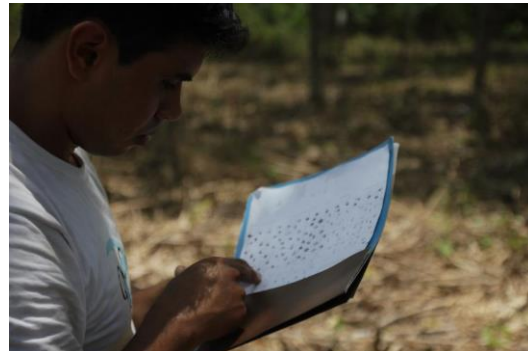
Señal en sitio con forestería análoga en Ngoketunja, Camerún y sesión de siembra en un sitio en Puerto Maldonado, Perú